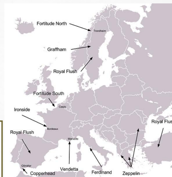
Карта основных направлений открытия второго фронта в Европе, как они были представлены Верховному командованию вермахта в ходе операции «Бодигард»