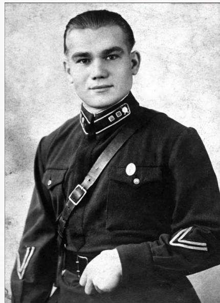
Герой Советского Союза, национальный герой Франции Василий Порик.