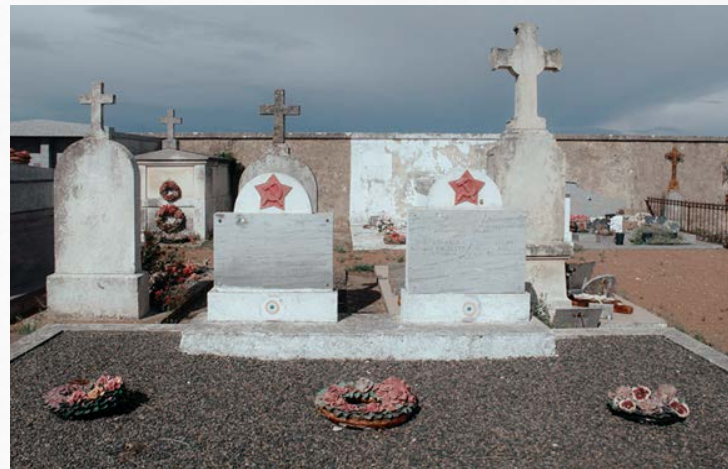
Кадр из фильма «Голоса Олерона». 2022 г. Реж. Степан Решетников.

Советские солдаты во главе с эмигрантом Сосинским смогли выкрасть для французского Сопротивления план немецких батарей на острове и взорвать главный склад боеприпасов. В момент высадки союзников на остров солдаты подняли восстание, испортили орудия на нескольких батареях, выведя из строя часть немецкого военного персонала.