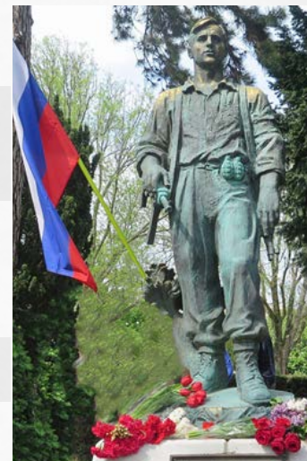
Памятник русским партизанам — участникам французского движения Сопротивления — на кладбище Пер-Лашез в Париже, открытый 3 мая 2005 г.