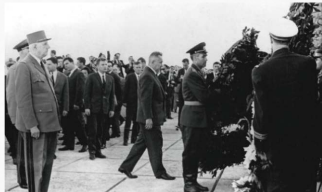
На Мамаевом кургане. Слева направо: Президент Франции Шарль де Голль, Маршал артиллерии Н.Н. Воронов, Председатель Совета Министров СССР А.Н. Косыгин. г. Волгоград. Июнь 1966 г.

«... Я хочу воздать должное Сталинграду и отметить тот урок, который он нам дает... Сталинград является не только символом побед, он является прекрасным уроком того, что могут сделать союзники, объединившиеся вместе против ненавистной Германии...». – Из речи Главы Временного Правительства Французской Республики Ш. де Голля, 30 ноября 1944 г.