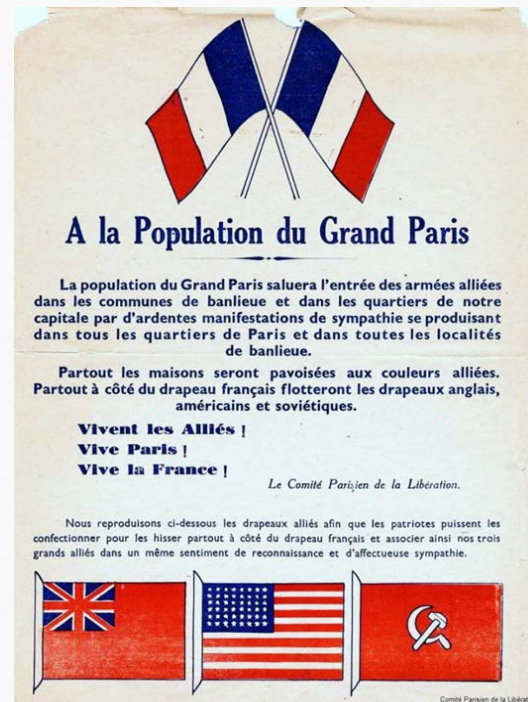
Плакат, прославляющий союзников Франции. Флаг СССР также участвовал в Параде в честь освобождения Парижа.