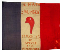
Знамя батальона «Сталинград» французских партизан Место хранения: ГЦМСИР