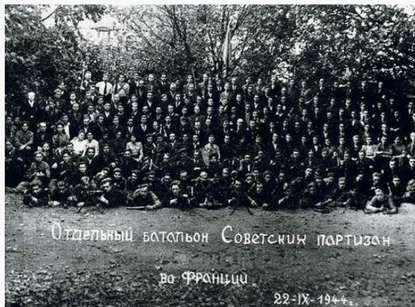
Отдельный батальон советских партизан во Франции.

«...не падать духом и не терять надежду на победу Красной армии над фашистскими захватчиками, высоко держать и не ронять достоинство гражданина СССР, использовать любую возможность, чтобы навредить врагу»