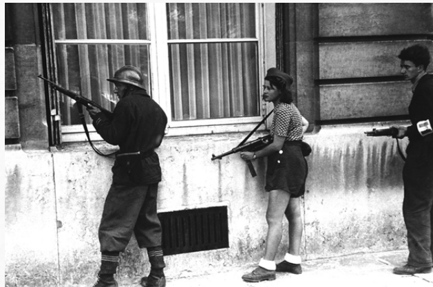
Патруль парижских повстанцев выслеживает немецких снайперов.

Тактические успехи союзных войск и их близость к Парижу побудили Свободные французские силы – парижских подпольщиков, начать восстание в городе. Фактически Париж был освобождён группами Сопротивления до вступления в город союзников.